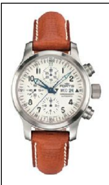
Fortis B-42 Flieger Chronograph